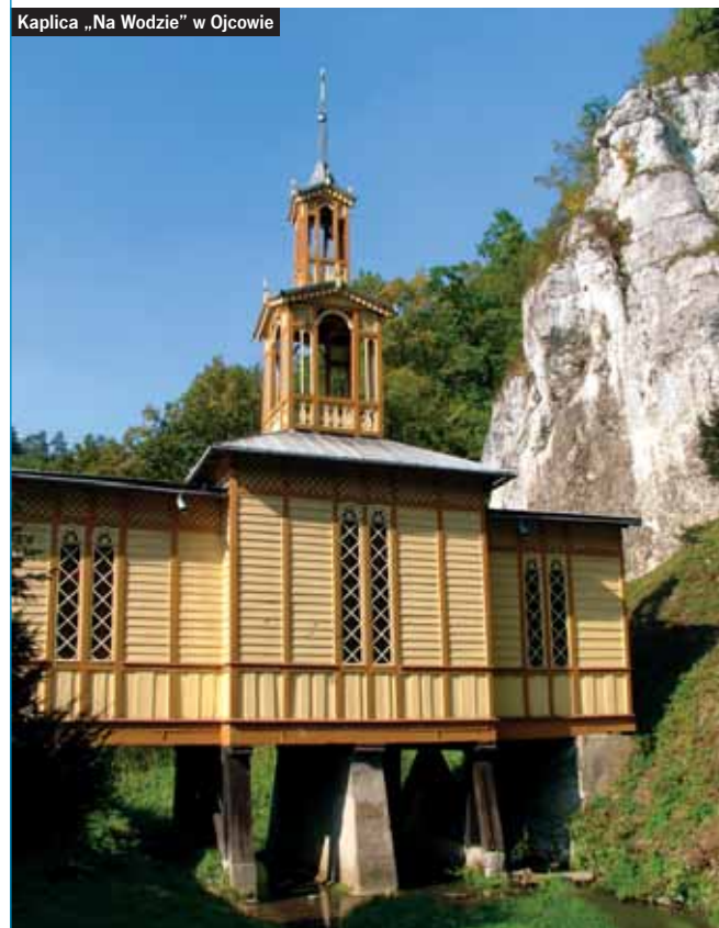
Kaplica „Na Wodzie” w Ojcowie

Od 1855 r. przez blisko pół wieku Ojców był uzdrowiskiem. Pozostałością z czasów uzdrowiskowej świetności jest park zamkowy z okazami starych drzew oraz drewniane domy w stylu ojcowskim. Najbardziej okazała budowla to odrestaurowany niedawno budynek hotelu Pod Kazimierzem. Obecnie stanowi on reprezentacyjną siedzibę dyrekcji Ojcowskiego Parku Narodowego. W dawnym hotelu Pod Łokietkiem mieści się dzisiaj Muzeum OPN im. prof. Władysława Szafera. W tzw. Bazarze Warszawskim swoją siedzibę ma z kolei Muzeum Regionalne PTTK. Wystawa prezentuje etnografię Ojcowa i historię uzdrowiska.