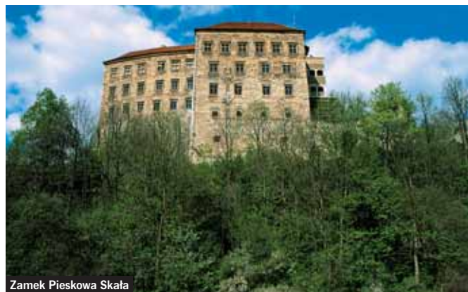
Zamek Pieskowa Skała

Kościół i pustelnia bł. Salomei , Grodzisko 5, tel. 012 452 61 16, możliwość zwiedzania na życzenie, klucze w domu prebendarza przy kościele